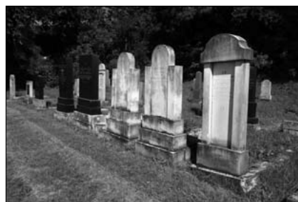
Pohľad na novšiu časť cintorína vo Filakove