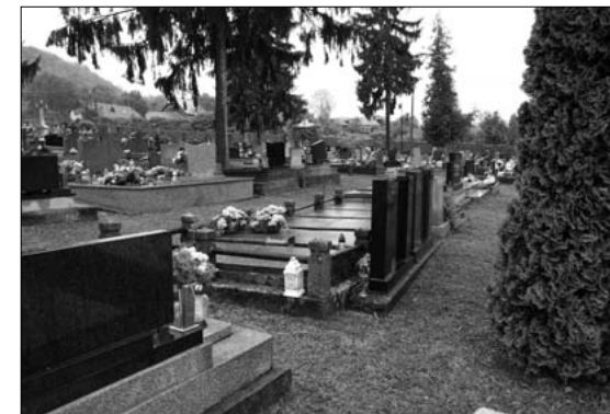
Okrskok hrobov židovskej komunity na miestnom cintoríne v Modrom Kameni