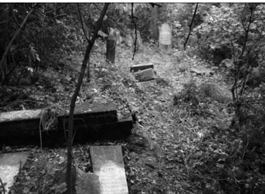
Celkový pohľad na čiastočne upravený cintorín v Poltári – Zelenom