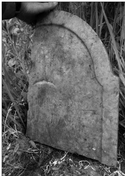
Úlomok náhrobného kameňa z cintorína v Želovciach