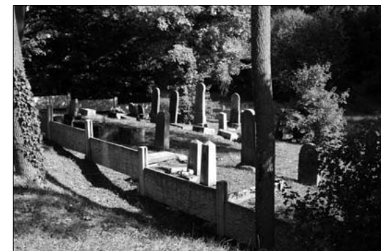
Pohľad na cintorín v Haliči

nou čiastkou na kúpu pozemku pre cintorín. Náboženská obec si zachovala ortodoxný charakter aj po rozkole v uhorských židovských komunitách (13). Iný zdroj hovorí, že spolok Chevre kadiša bol založený už v roku 1820 a že v tom istom roku dostali filakovskí židia povolenie na zriadenie cintorína pri Šávoľskej ceste (14). Cintorín sa nachádza na okraji mesta. Mnohí z tých, ktorí sa po holokauste vrátili do Filakova, videli svoju budúcnosť v novovzniknutom štáte Izrael a emigrovali. Keďže židovská obec zanikla, cintorín v ďalšom období chátral. Po Zamatovej revolúcii v deväťdesiatych rokoch 20. storočia bol, vďaka finančnej podpore jednej z najbohatších židovských rodín v Austrálii, rodiny Löwy zo Sydney, ktorých korene sú vo Filakove, zrekonštruovaný. Zásluhou rodiny Löwy je cintorín aj naďalej udržiavaný v bezchybnom stave (14).