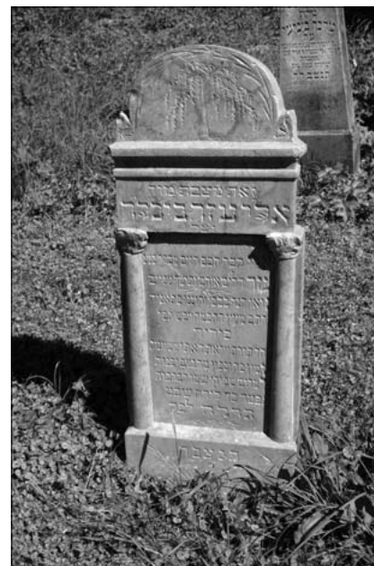
Hrob prvého filakovského rabína Eliezera Büchlera (Lazar Büchler), zomrel 24. švatu 5635 (30. januára 1875)