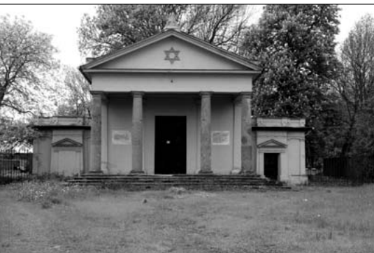
Obradná miestnosť na neologickom cintoríne v Lučenci