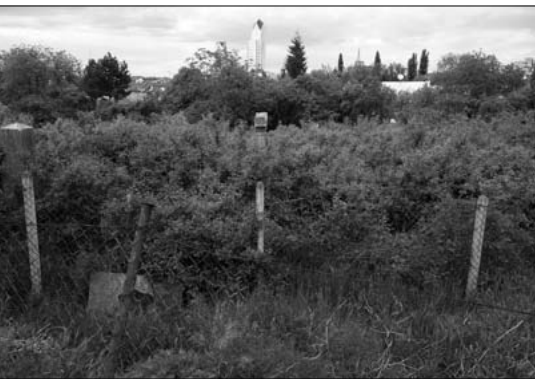
Ortodoxný cintorín v Lučenci, stav v máji 2019