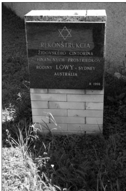
Pamätná tabuľa rodiny Löwy na cintoríne vo Filakove