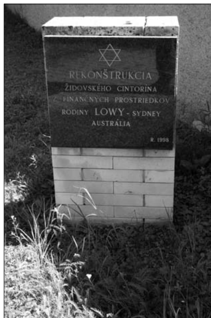
Pamätná tabuľa rodiny Löwy na cintoríne vo Filakove