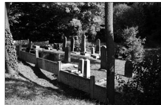
Pohľad na cintorín v Haliči