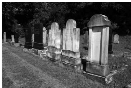
Pohľad na novšiu časť cintorína vo Filakove